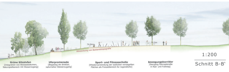
1:200 Schnitt B-B'