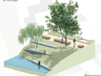
Begasteg Statt eines klassischen Bahnhofsvorplatzes sieht das Konzept eine Promenade an der Bega, die neben Grün-sitzstufen am Wasser auch einen Naturspielbereich bietet