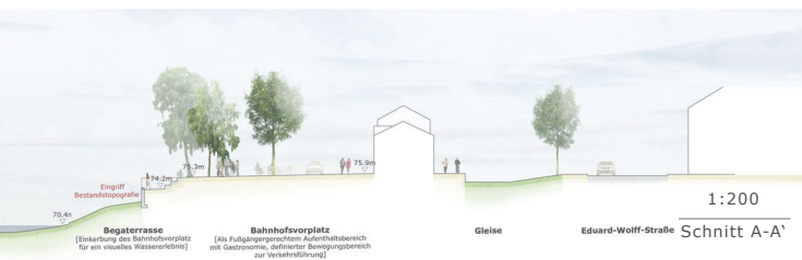
1:200 Schnitt A-A'

Am Bahnhof Schötmar soll ein moderner Verkehrsknoten entstehen, der nachhaltigen und zukunftsfähigen Bewegungsmodi einen klaren Vorrang einräumt und entsprechende Angebote bietet. Darunter fallen sowohl Sharing Angebote von E-Bikes und Scootern wie auch E-Autos, als auch Stellplätze mit Lademöglichkeiten. Der gesamte Bahnhofsbereich ist fußgängerfreundlich gestaltet und weist für KFZ klar definierte Fahrbereiche aus auf denen sie jedoch auch einen untergeordneten Rang einnehmen. So stellt die Zufahrt zum Parkplatz den einzigen befahrbaren Bereich dar, der jedoch zugleich Mischverkehrsfläche mit Vorrang für Fußgänger und Radfahrer. Zwei Platzbereiche begrenzen den befahrbaren Bereich.